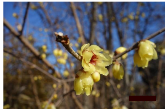
京都府立植物園 ロウバイ